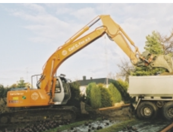
STADIG NYE MASKINER: Store investeringer og fornyning av maskin- parken er viktig for profil og tillitt.

– Dette er kun ett av oppdragene, vi har ganske mange i gang hele tiden. Det er nok å gjøre. Vi er for eksempel nettopp ferdig med anlegget til Byggmakker på Tingvoll