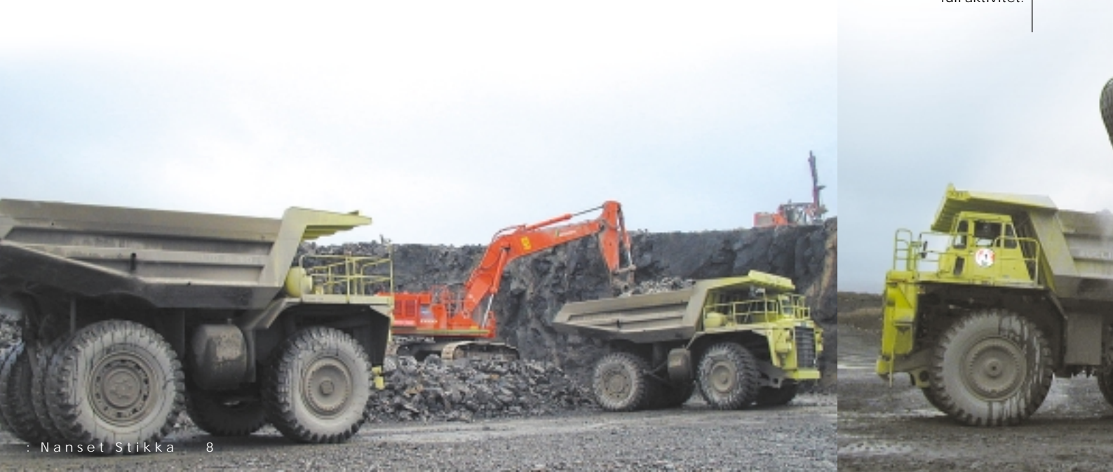
DUMPERE: Hitachi EX1100 og bedriftens 2 R130 i full aktivitet.