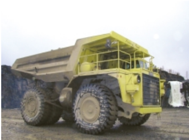
EUCLID: Feiring Bruk har 2 stykker R130 Euclid-dumpere.