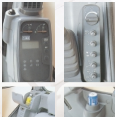
Høy komfort i hytta