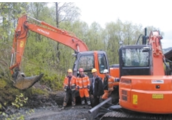
PÅ NYE OPPDRAG: Fra å lage skogsveier er den største delen av jobben idag VA-anlegg.