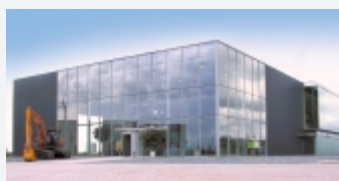
Hitachi's nye anlegg i Amsterdam. Åpnet januar 2003.