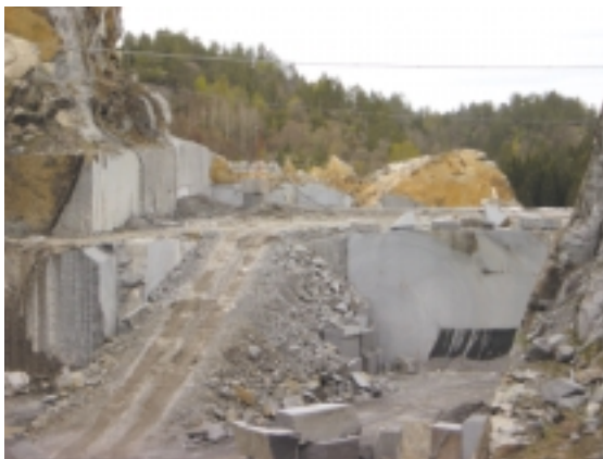
STORE OMRÅDER: Med en produksjon på hele 17.000 m 3 er Klåstad Brudd DA storutvinner av mørk labrador.

Det største bruddet er Klåstad Brudd DA i Tjølling som utvinner en type mørk labrador. De har 60 ansatte og en produksjon på 17.000 m 3 .