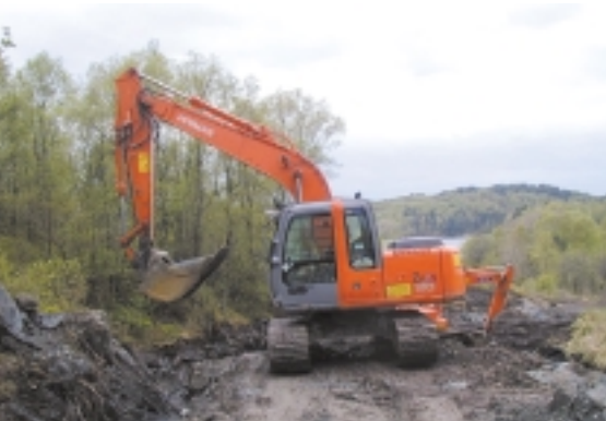
NY MASKIN I FULLT ARBEID: Den nye ZX120 får ikke mange pauser, her går det i ett.....