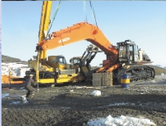
FISKELYKKE: Mekaniker Jan Nordby fra Nanset Standard, endelig klar med montering av ZX 850 og kan nyte den flotte naturen.