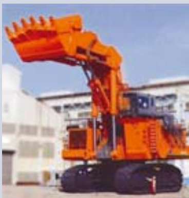
Hitachi EX 8000: