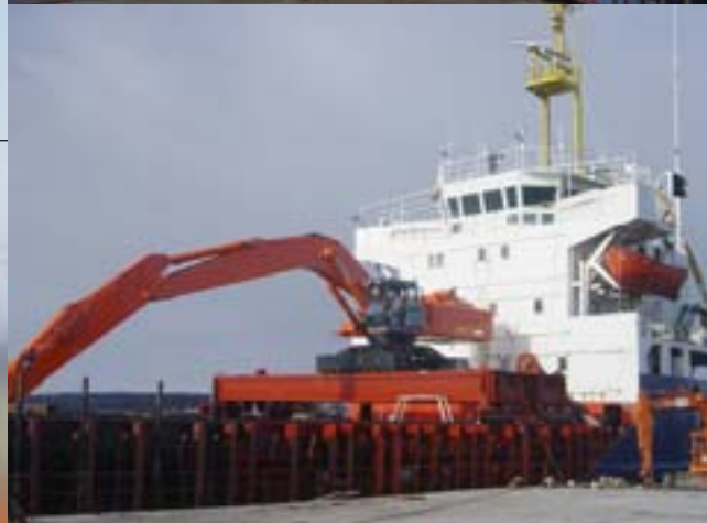
NY ARBEIDSPASS: ZX 850 godt plassert på dekk – klar til oppdrag.