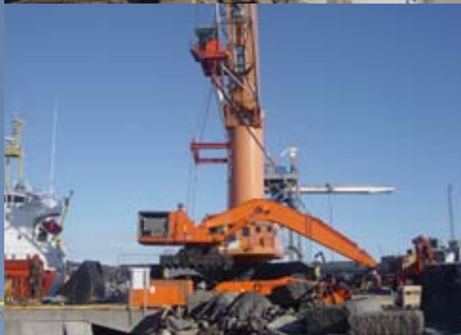
80-TONNER PÅ LUFTETUR: Kraftig kran må til for å løfte 80-tonneren fra kaia og opp på båtdekket. Et utrolig syn.