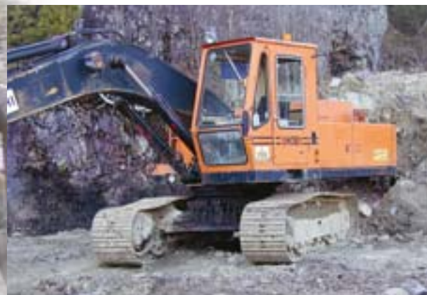
UH081: 22 år og fortsatt i daglig drift!