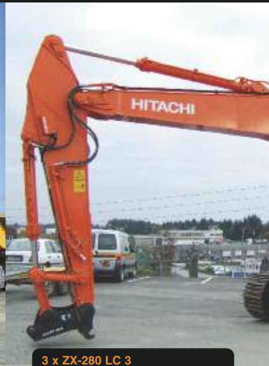
3 x ZX-280 LC 3