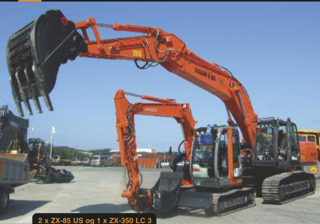
2 x ZX-85 US og 1 x ZX-350 LC 3