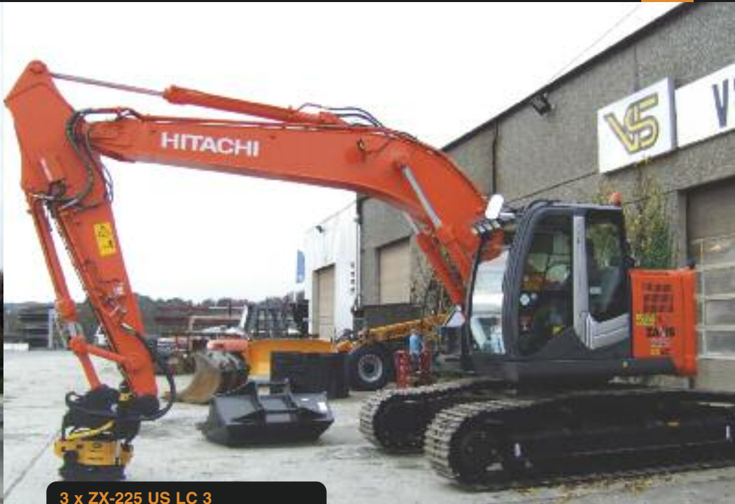
3 x ZX-225 US LC 3