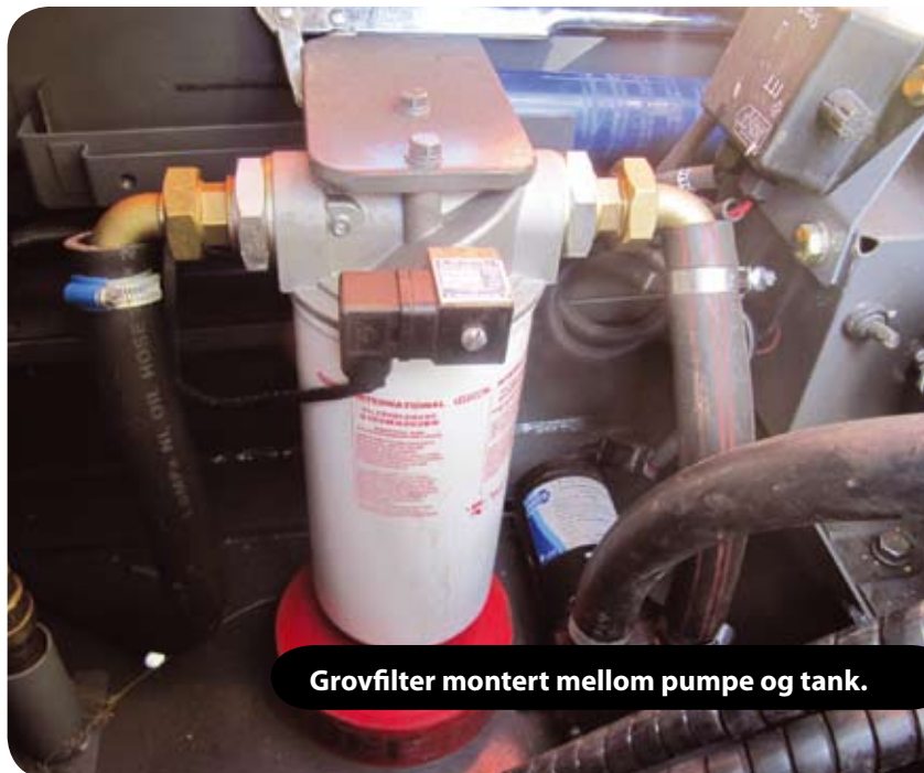
Grovfilter montert mellom pumpe og tank.

Firmaet utviklet så, i samarbeid med Nanset Standard og Vera Tank, en bunkers-tank med hurtigkoblinger. Dette for at fyllingen fra tanken til maskinen skulle bli helt lukket. Dermed blokkeres vann og eventuelle urenheter fra å ta seg videre inn i maskineriet. 18-tonneren har nå kjørt 4 måneder med denne anordningen, og Grongstad vurderer nå å ettermontere samme system på firmaets øvrige maskinpark.