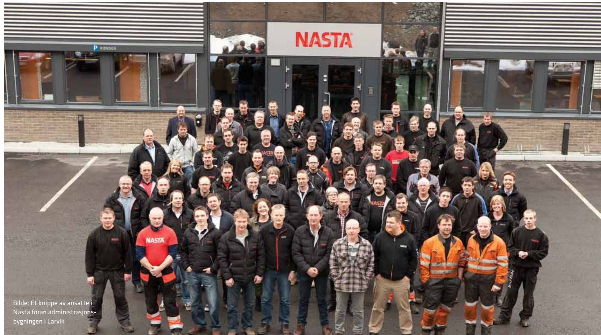
Bilde: Et knippe av ansatte i Nasta foran administrasjonsbygningen i Larvik