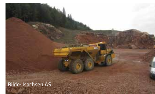
Bilde: Isachsen AS