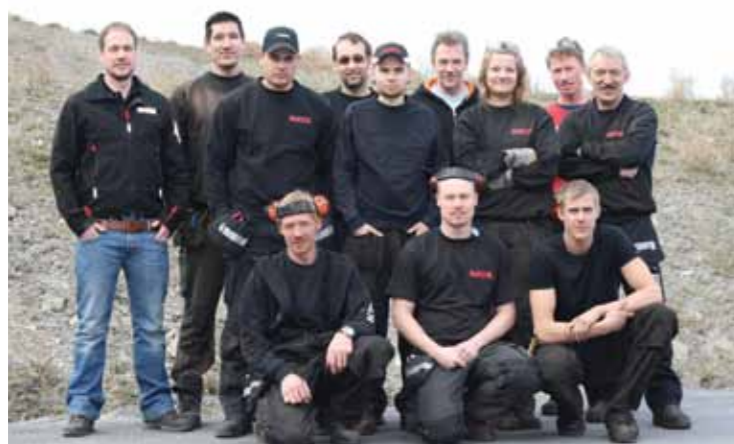
Bildet: En del av gjengen som til daglig jobber hos Nasta spesialproduksjon

Nasta Spesialproduksjon (NSP) er satt opp som en egen avdeling hos Nasta AS. Den består av sveiseverksted, monteringshall og lakkhall. NSP har egen konstruksjonsavdeling som tegner og beregner, samt en teknisk avdeling som løser hydrauliske og elektriske utfordringer. Dessuten har avdelingen en egen funksjon for kvalitetskontroll og oppfølging av nødvendige standarder. Spesialprosjektene blir selvfølgelig levert med nødvendig CE- godkjenning.