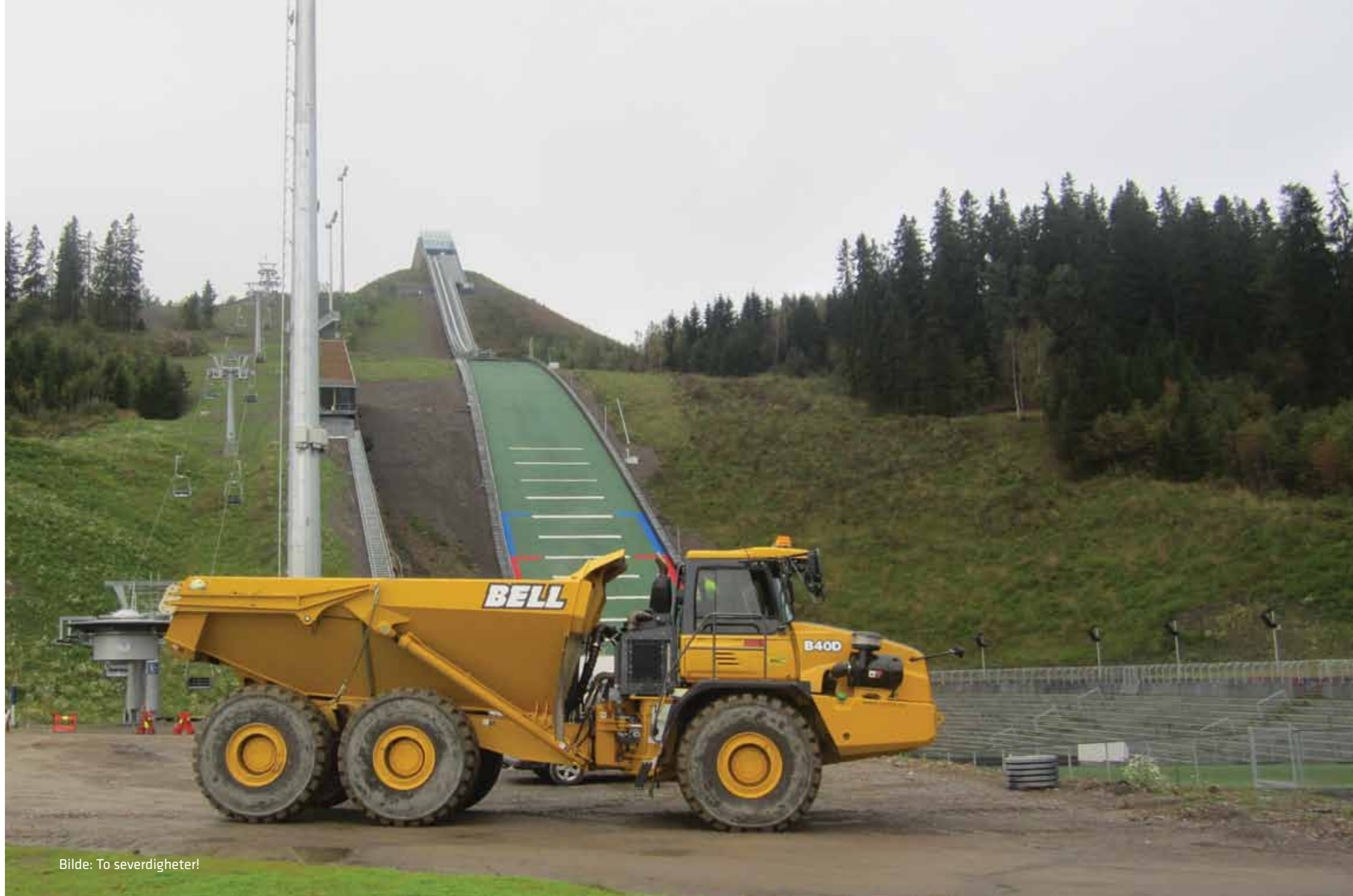
Bilde: To severdigheter!

MANGE BEDRIFTER FIKK HØSTEN 2011 BESØK AV EN B40D